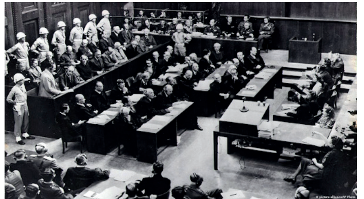
פושעי המלחמה הנאצים ימ"ש. משפטי נירנברג, 1946.

הדמיון הרב בין הקטע הזה בסיפור המגילה, ולבין מה שאתאר בהמשך - מביא את המתבונן להגיע למסקנה מפעימה: ייתכן שהייתה זו נבואה שמדברת על עשרת נידוני נירנברג. משפטי נירנברג, 1946.