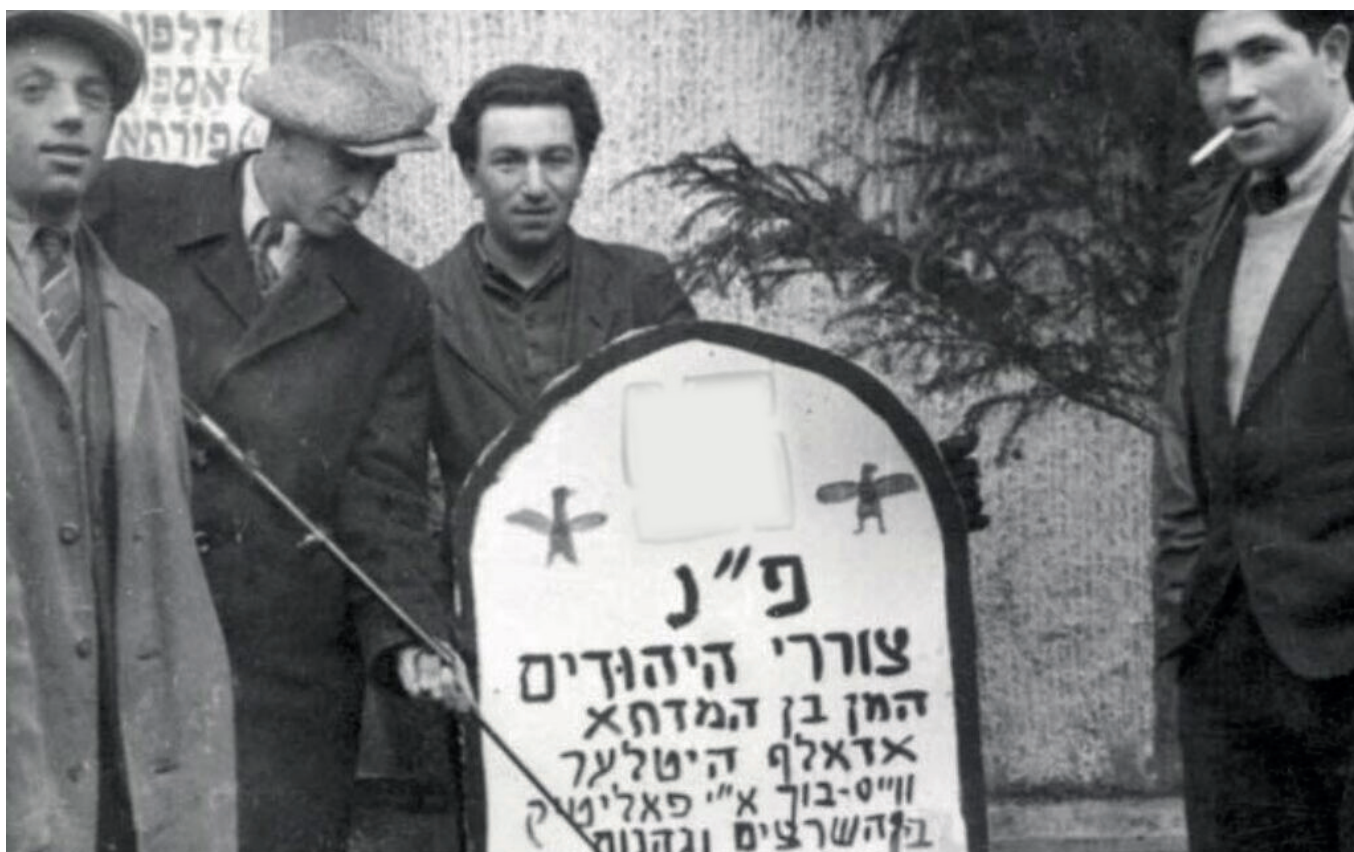
ניצולים יהודים במחנה "לנדסברג" ניצבים ליד שלט דמוי מצבה שנעשה כלגלוג על היטלר. עיג השלט: "פה נקבר צורר היהודים המן בן המדחא אדולף היטלר"