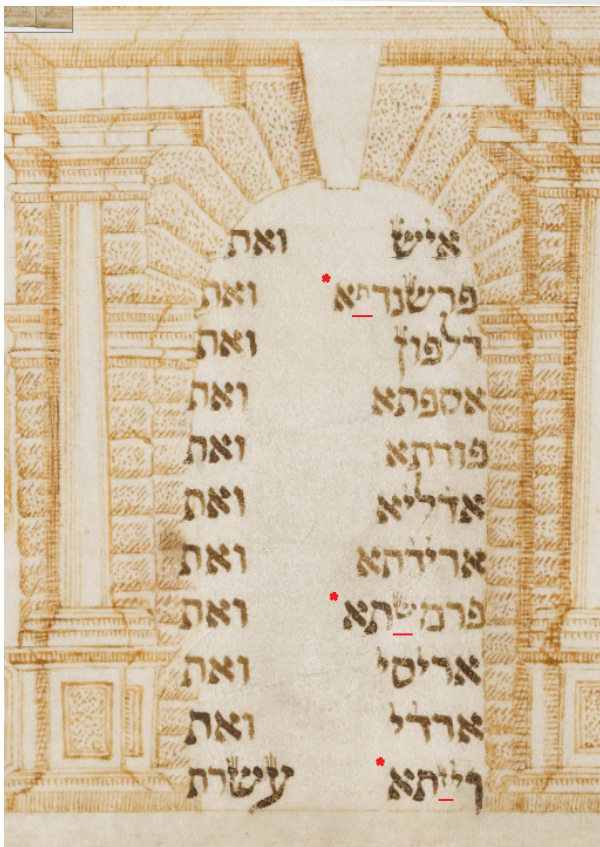
צילום מתוך האוסף כתבי היד הפרטי של ברגינסקי, מגילת אסתר, אמסטרדם שנת 1641 למנינם. צילום: ידידי היקר, צלם כתבי היד: ארדון בר חמא.

בני המן בן-המדתא צרר היהודים הרגו ובבזה לא שלחו את-ידם: ביום ההוא בא מספר ההרוגים בשושן הבירה לפני המלך: י ויאמר המלך לאסתר המלכה בשושן הבירה הרגו היהודים ואבד חמש מאות איש ואת עשרת בני-המן בשאר מדינות המלך מה עשו ומה-שאלתך וינתן לך ומה-בקשתך עוד ותעש: יג ו תאמר אסתר אם-על-המלך טוב ינתן גם-מחר ליהודים אשר בשושן לעשות כדת היום ואת עשרת בני-המן יתלו על-העץ: